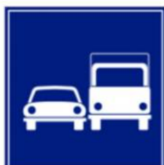
Autoveicoli- Acquisto, noleggio, sconti