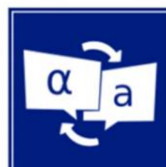
Traduzioni ed Interpreti