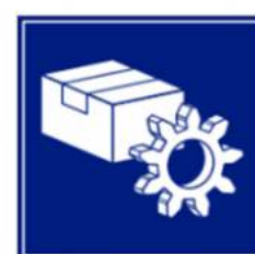
Prodotti e Servizi per l'impresa