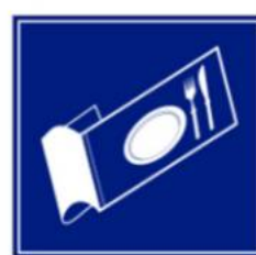
Buoni pasto e acquisto