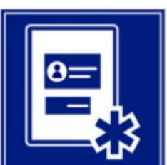
Sanità, Benessere, Polizze assistenziali e assicurative