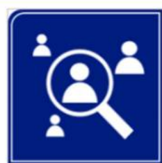
Agenzie per il lavoro