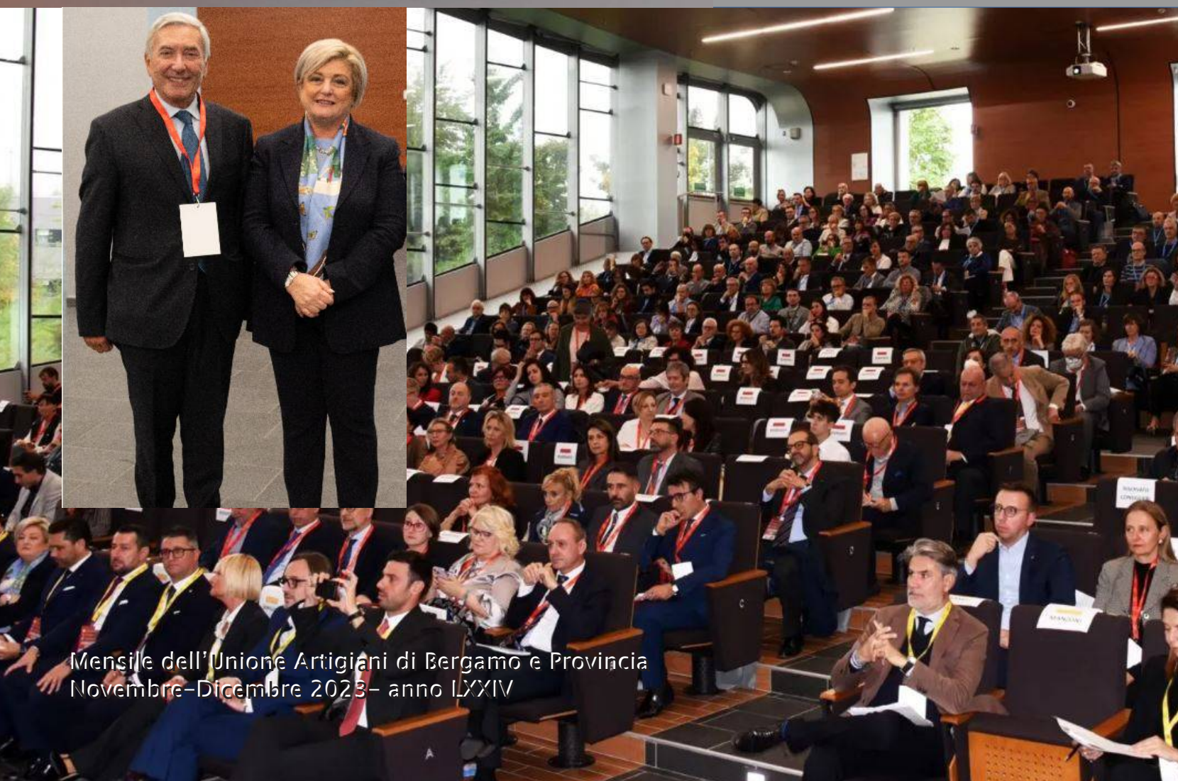
Mensile dell'Unione Artigiani di Bergamo e Provincia Novembre-Dicembre 2023 - anno LXXIV