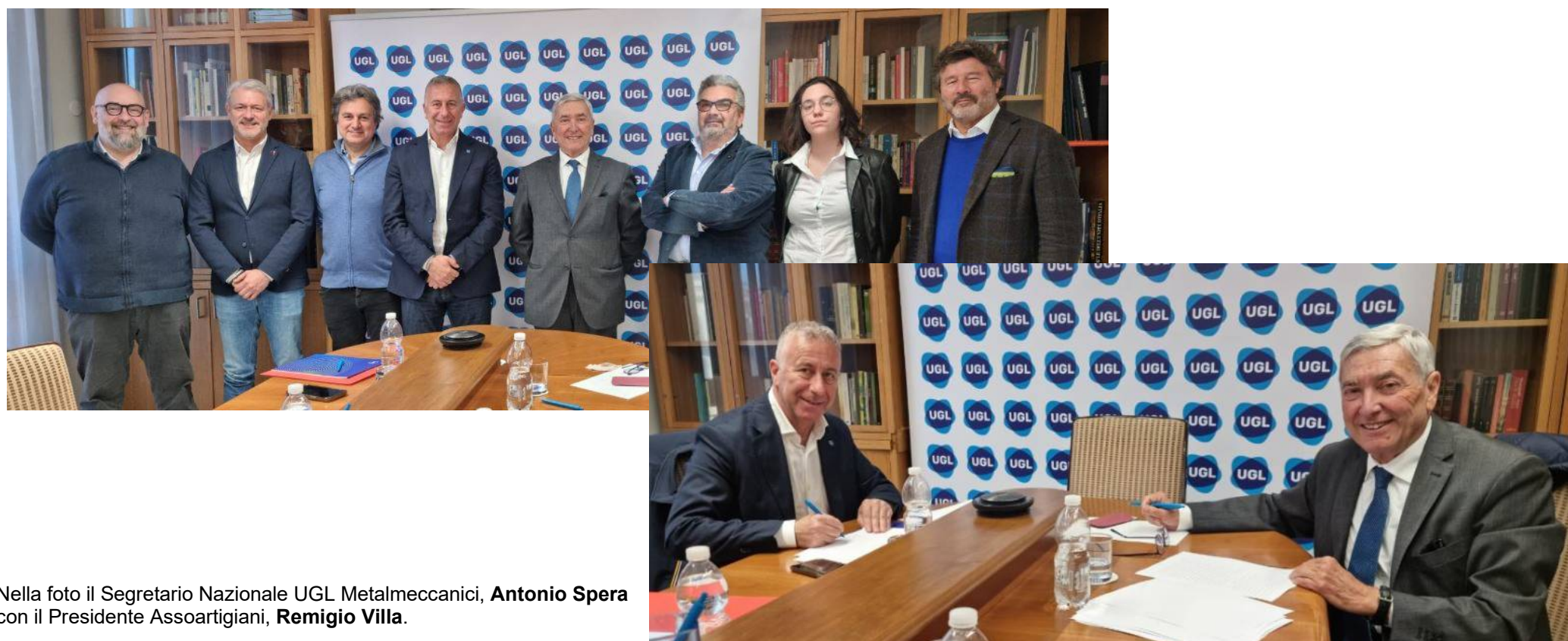
Nella foto il Segretario Nazionale UGL Metalmeccanici, Antonio Spera con il Presidente Assoartigiani, Remigio Villa .

Dopo la sottoscrizione il 19 ottobre scorso del Contratto Collettivo Nazionale di Lavoro per le micro e piccole imprese metalmeccaniche, di installazione di impianti, orafi, argentieri e affini", lo scorso 19 aprile 2023, è stato sottoscritto l'accordo per la costituzione dell'ente bilaterale E.B.A.U.M. tra Assoartigiani ed UGL Metalmeccanici.