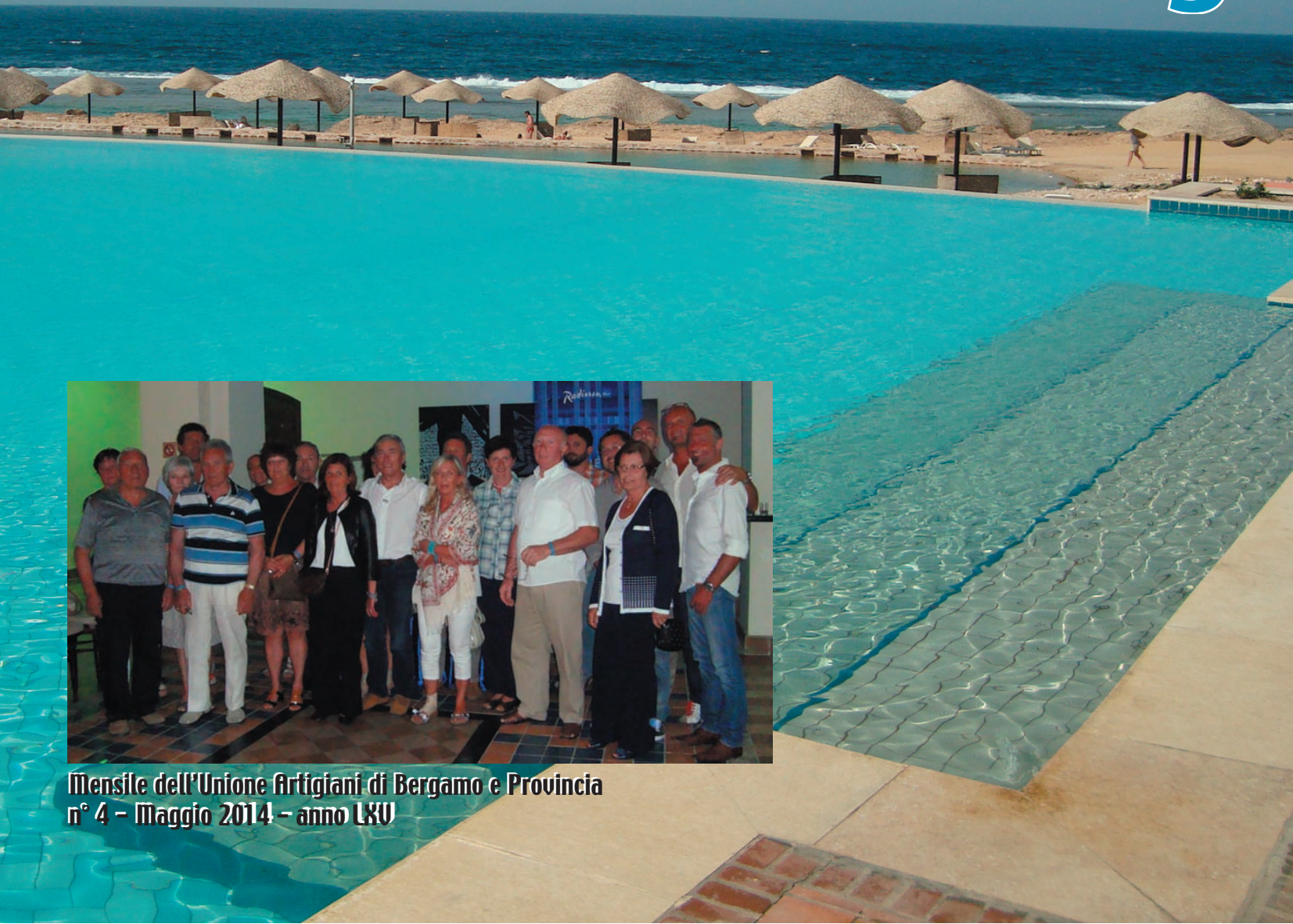
Mensile dell'Unione Artigiani di Bergamo e Provincia n° 4 - Maggio 2014 - anno LXXV