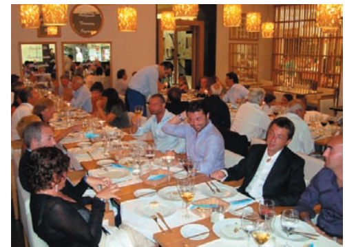
Partner del Convegno: BCC di Zanica