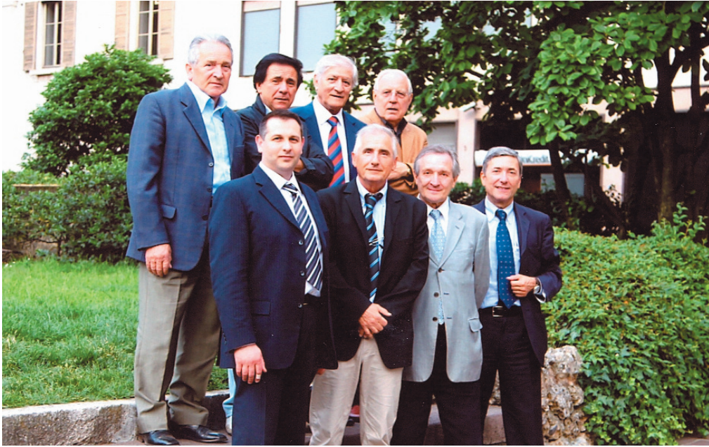
Il Consiglio di Amministrazione Artigianfidi Bergamo